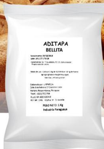
Mix Aditapa 1 kilo Cód. 1103