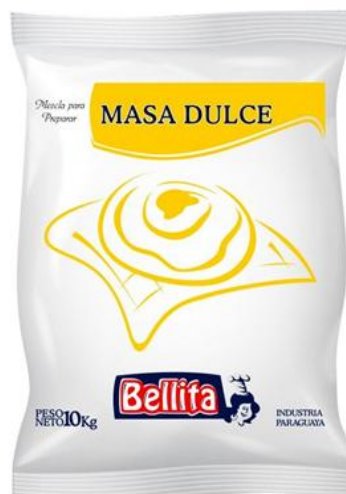
Masa Dulce 10 kilos Cód. 1901