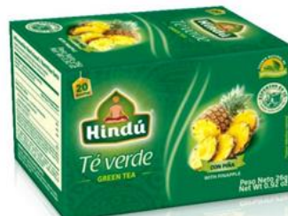
Té Verde c/ Sabor a Piña Caja 20 saq. 12 unid. - 5719