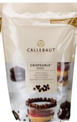
Crispearls Amargo CED 800 g - 1 unid. - 9258