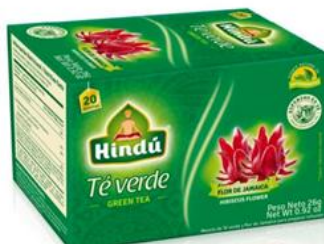
Té Verde c/ Flor de Jamaica Caja 20 saq. 12 unid. - 5725