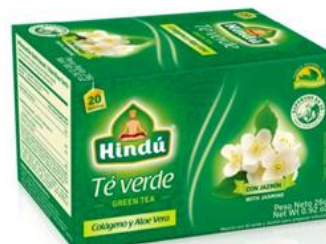
Té Verde c/ Jazmín Caja 20 saq. 12 unid. - 5745