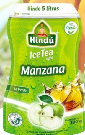
Té Helado Manzana 300 gr 12 unid. - 5716