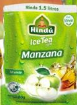
Té Helado Manzana 60 gr 12 unid. - 5721