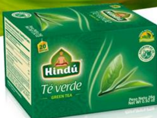
Té Verde Clásico Caja 20 saq. 12 unid. - 5711