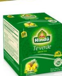
Té Verde c/ Sabor a Piña Caja 10 saq. 12 unid. - 5724