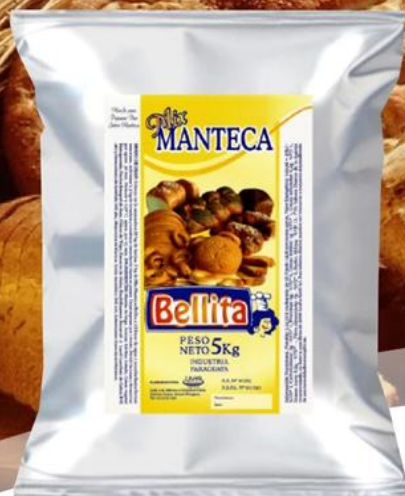
Mix Manteca 5 kilos Cód. 1515