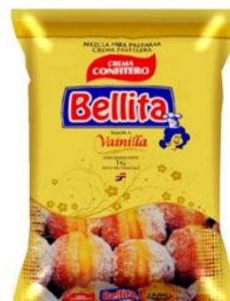
Bellita Crema Confitero 1 kilo - 10 unid. - 6761