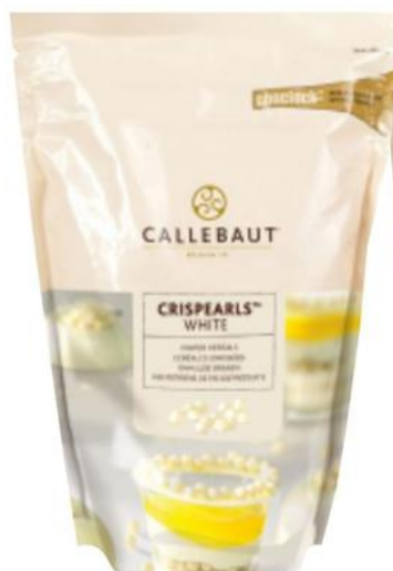
Crispearls Blanco CEW 800 g - 1 unid. - 9259