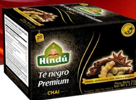
Té Negro Premium Sabor Chai Caja de 20 saq. 12 unid. - 5732