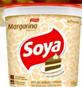
SOYA Margarina 50% Lípidos Balde 15 kilos - 3390