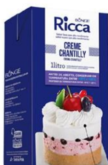
Ricca Crema Chantilly 1 litro - 12 unid. 3110