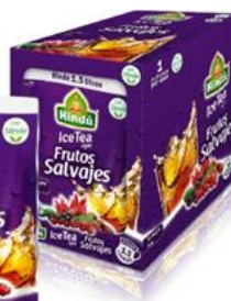
Té Helado Frutos Salvajes 60 gr 12 unid. - 5767