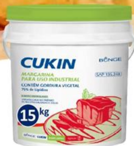
CUKIN Margarina 75% Lípidos Balde 15 kilos - 3324