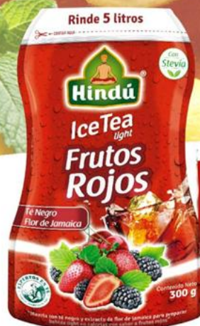
Té Helado Frutos Rojos 300 gr 12 unid. - 5744