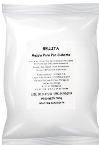
Pan Ciabatta 10 kilos Cód. 1914