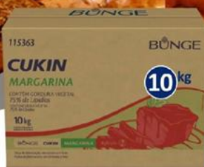
CUKIN Margarina 75% Lípidos Caja 10 kilos - 3326