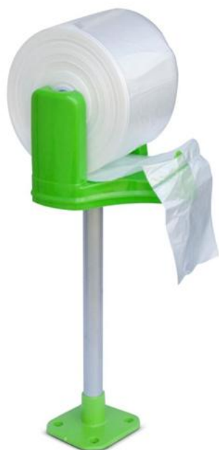
25 X 40 X 6,5 Micrones Fondo Estrella 1 unid. - 1352