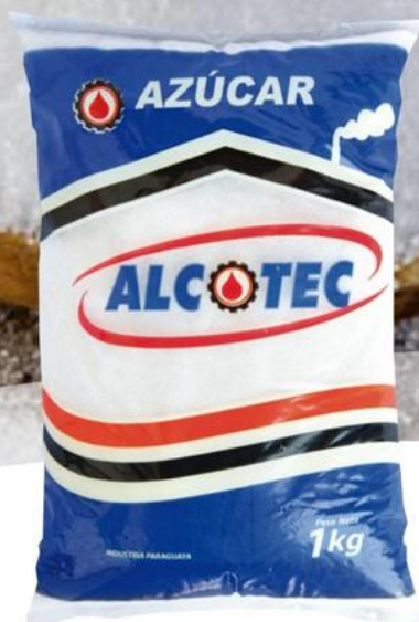
Azúcar Blanca 1 kg - 30 unid. - 1318