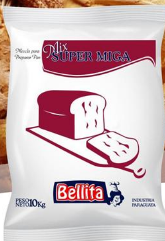
Mix Super Miga 5 kilos Cód. 1905