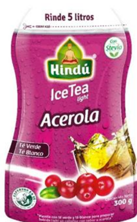
Té Helado Acerola 300 gr 12 unid. - 5717