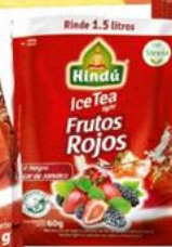
Té Helado Frutos Rojos 60 gr 12 unid. - 5766