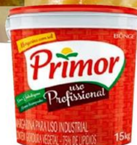
PRIMOR Margarina 75% Lípidos Balde 15 kilos - 3006