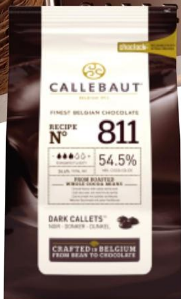
Chocolate Semi-Amargo (811NW79) 1 kg - 1 unid. - 9231