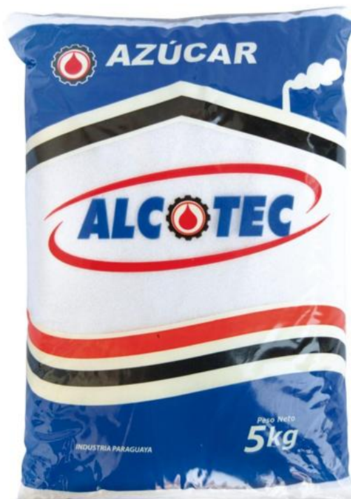
Azúcar Blanca 5 kg - 6 unid. - 1320