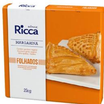
Ricca Margarina Hojaldre Caja 12 kilos - 3040