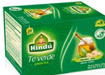
Té Verde Jengibre - Miel Caja 20 saq. 12 unid. - 5718