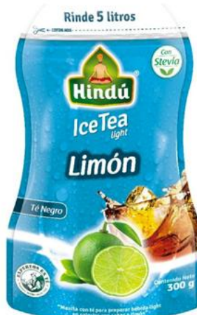
Té Helado Limón 300 gr 12 unid. - 5714