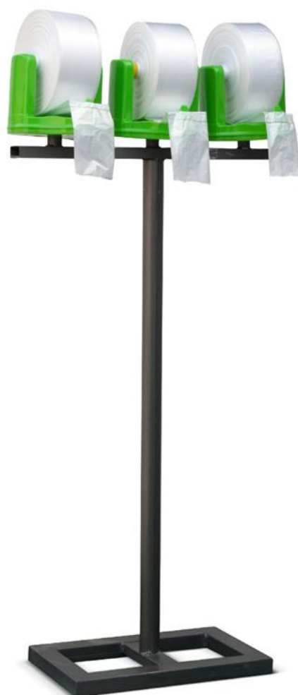
39 X 60 X 10 Micrones Fondo Estrella 1 unid. - 1347