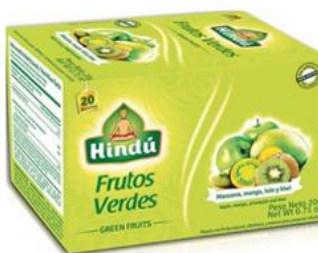
Infusiones de Frutos Verdes Caja 20 saq. 12 unid. - 5702