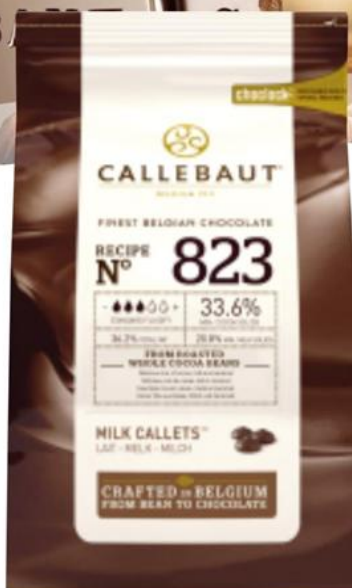
Chocolate con Leche (823NW79) 1 kg - 1 unid. - 9232