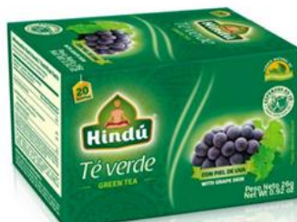
Té Verde c/ Piel de Uva Caja 20 saq. 12 unid. - 5720