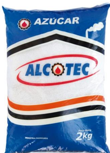
Azúcar Blanca 2 kg - 15 unid. - 1319