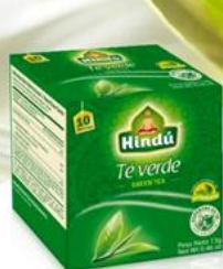
Té Verde Clásico Caja 10 saq. 12 unid. - 5723