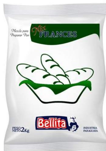
Mix Francés 2 kilos Cód. 1902