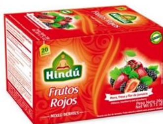
Infusiones de Frutos Rojos Caja 20 saq. 12 unid. - 5700