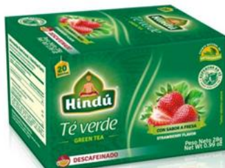
Té Verde Descafeinado Caja 20 saq. 12 unid. - 5703