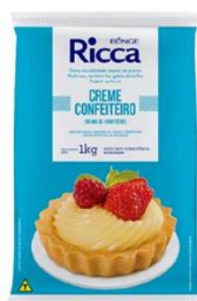
Ricca Crema Confitero 1 kilo - 10 unid. - 3490