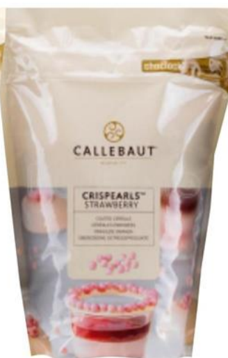
Crispearls Fresa CEF 800 g - 1 unid. - 9257