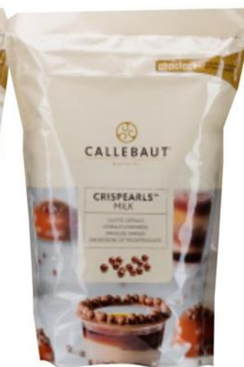
Crispearls Leche CEM 800 g - 1 unid. - 9263