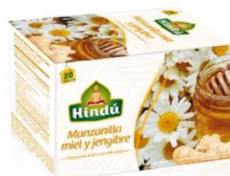
Aromática Manzanilla, miel y jengibre Caja 20 saq. 12 unid. - 5726