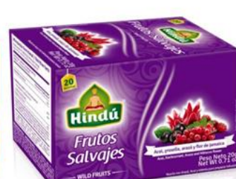
Infusiones de Frutos Salvajes Caja 20 saq. 12 unid. - 5746