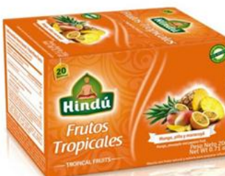
Infusiones de Frutos Tropicales Caja 20 saq. 12 unid. - 5701