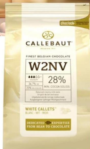
Chocolate Blanco (W2NV-W79) 1 kg - 1 unid. - 9238