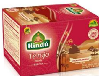
Té Rojo c/ Sabor a Crema Irlandesa Caja 20 saq. 12 unid. - 5712