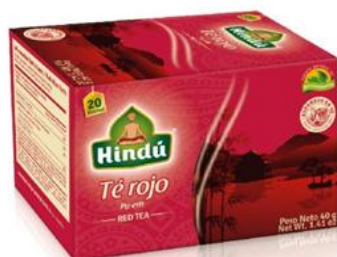
Té Rojo Hindú Caja 20 saq. 12 unid. - 5747